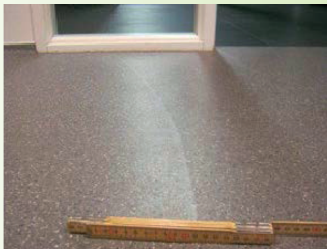
Afb. 5.3: Voorbeeld spaanslag