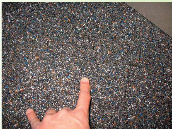
Afb. 5.2: Voorbeeld verdeling korrels

Te verwachten is dat bij een sterke ongelijkmatigheid in de verdeling van diverse tinten toeslagmateriaal, dit ook zijn weerslag zal hebben op het egaal ogen van de vloer.